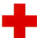
Biểu tượng của Hội Chữ thập đỏ quốc gia