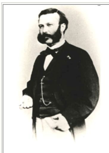
Henry Dunant - người sáng lập Phong trào CTĐ-TLLĐ quốc tế

Cảnh tượng trên đã khiến một thương gia Thụy Sĩ tên là Jean Henry Dunant kinh hoàng khi vô tình được chứng kiến. Ông đã kêu gọi dân chúng địa phương giúp đỡ người bị thương bất kể họ là người của bên nào.