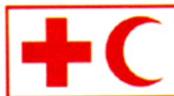
Biểu tượng của Hiệp Hội Chữ thập đỏ và Trăng lưỡi liềm đỏ quốc tế