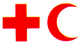
Biểu tượng của Phong trào Chữ thập đỏ và Trăng lưỡi liềm đỏ quốc tế

Ủy ban Chữ thập đỏ quốc tế và Hiệp Hội Chữ thập đỏ và Trăng lưỡi liềm đỏ quốc tế có thể sử dụng Biểu tượng trong mọi trường hợp và không có hạn chế nào. Luật Nhân đạo quy định về hình thức, phạm vi sử dụng Biểu tượng. Các Chính phủ tham gia Luật Nhân đạo đều phải thực hiện theo quy định này.